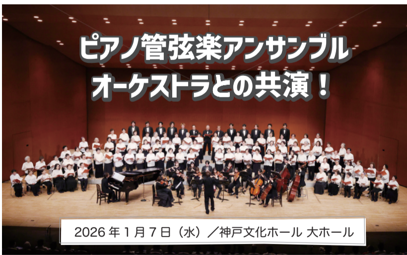
ピアノ管弦楽アンサンブル オーケストラとの共演!