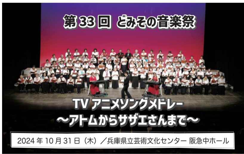
第33回 どみその音楽祭

2台のエレクトーンでの共演は迫力満点でした! 自分の名前を冠した課題曲「アニメソング集」のプログラムでしたが、舞台上でのサプライズ、「十方馬力だ鉄腕アトム」頑張り鈴木のアトム出演者の皆様からの応援、歌声は生涯の宝物です。