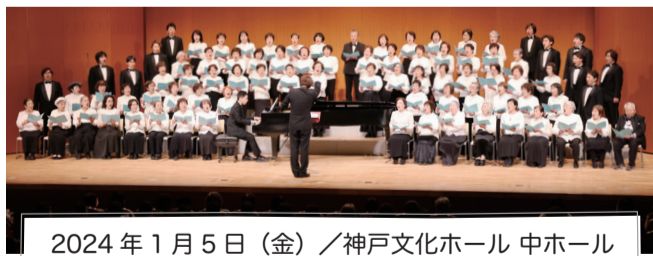
2024年1月5日(金) / 神戸文化ホール 中ホール