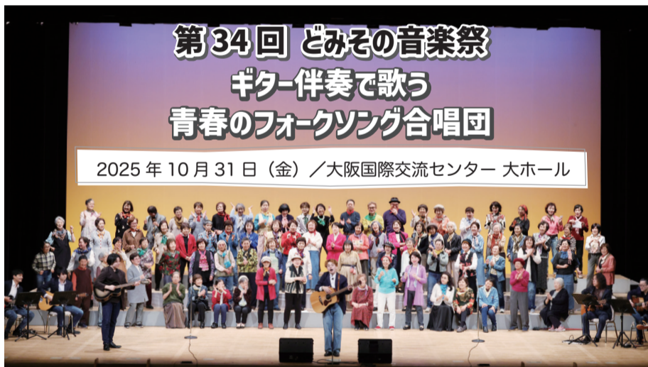
第34回 どみその音楽祭 ギター伴奏で歌う 青春のフォークソング合唱団