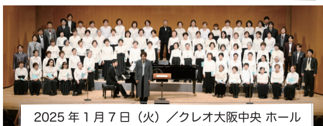
2025年1月7日(火) / クレオ大阪中央 ホール